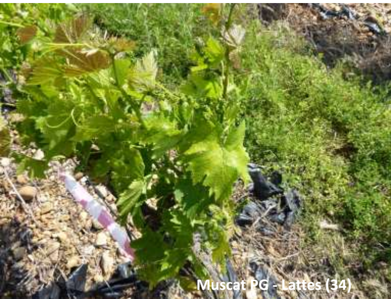
Muscat PG - Lattes (34)