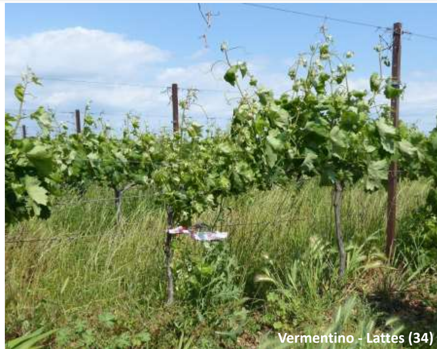
Vermentino - Lattes (34)