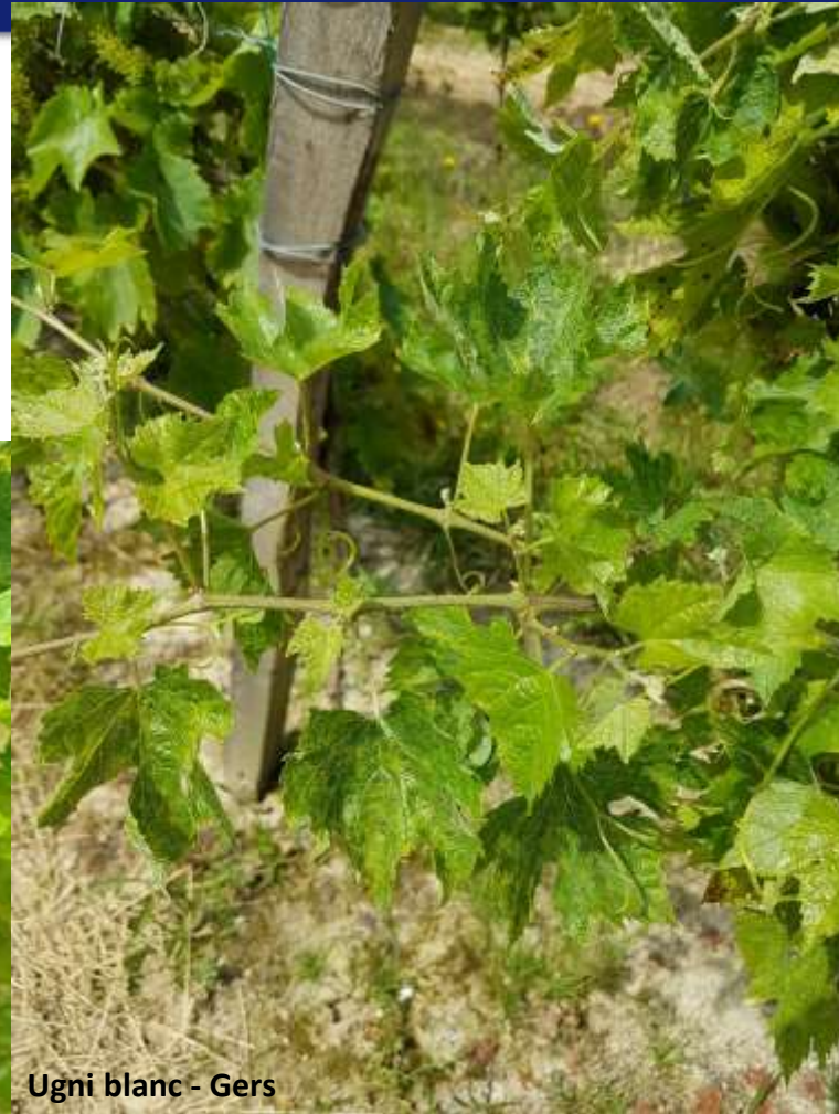
Ugni blanc - Gers

Le viticulteur a arraché les pieds S+ en 2018