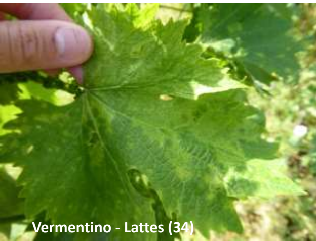
Vermentino - Lattes (34)