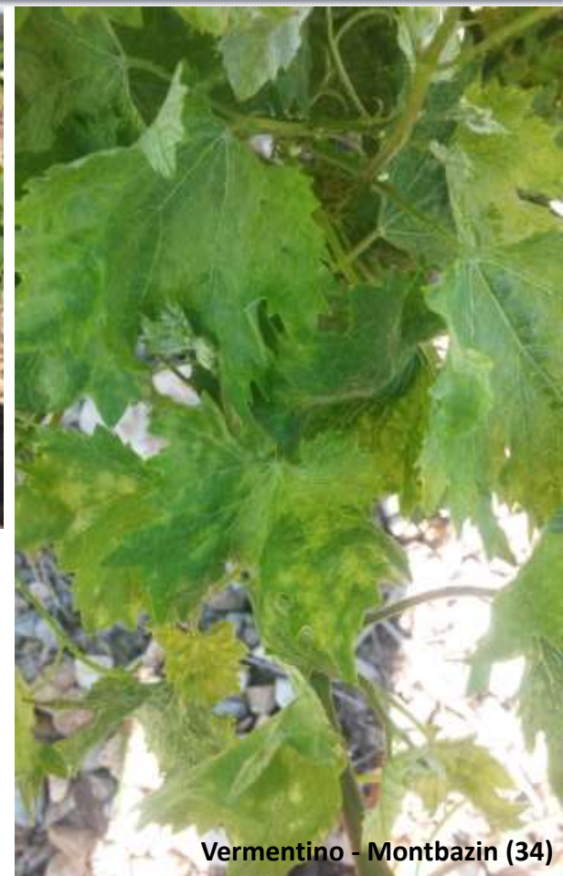
Vermentino - Montbazin (34)