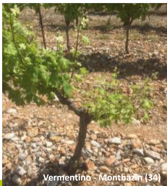
Vermentino - Montbazin (34)